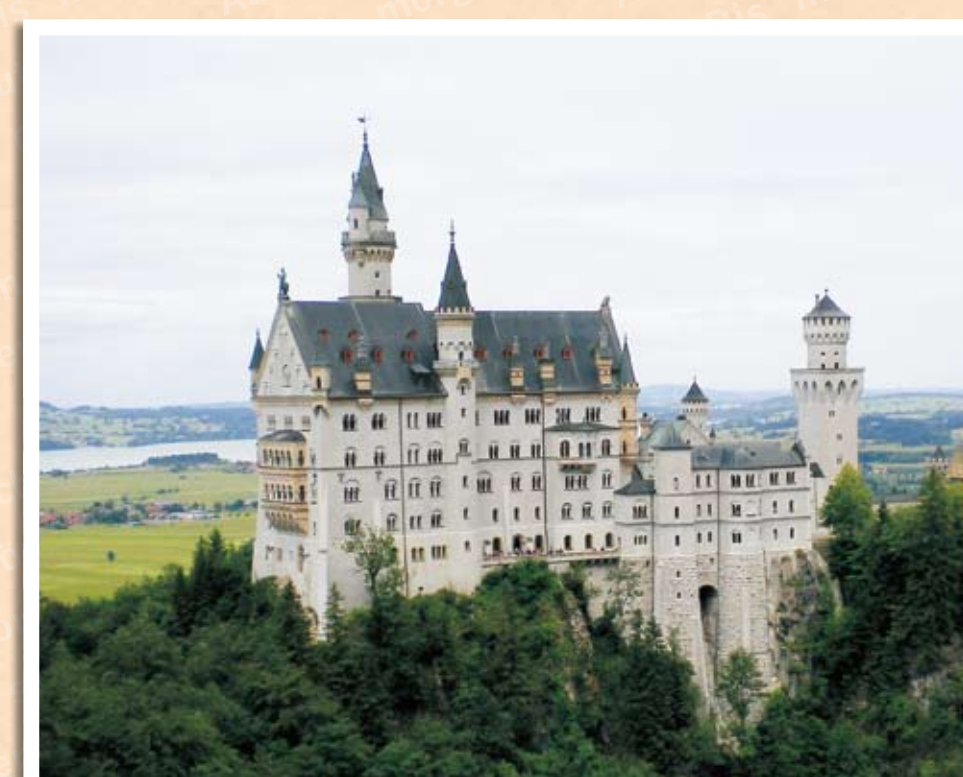
19世紀にルートヴィヒ2世によって建造されたノイシュヴァンシュタイン城

この時代は、政治的には暗い時代だったが、文化的には花開いた時代である。いわゆる文化人と呼ばれる人たちは、「ドイツは早く統一