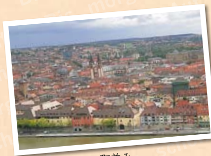
ヴュルツブルクの町並み

帝水は 全室オーシャンビュー。 どのお部屋からも 日本海の 雄大な景色を 眺めることができます。