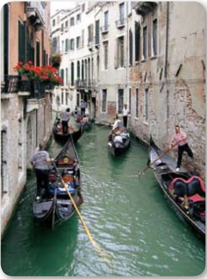
観光客を乗せて街の中を移動するゴンドラ

かし、時間があつたら、水上バスで対岸のサン・ジョルジョ・マジョーレ聖堂の教会から町全体を眺めるのもよろしいでしょう。