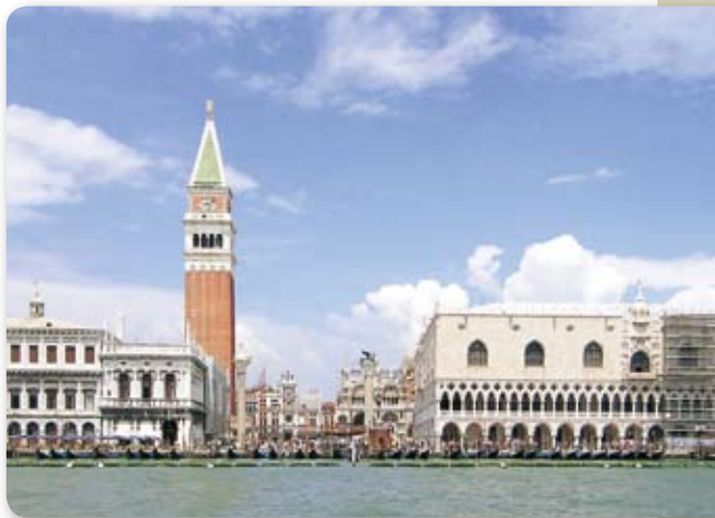
海側から見たサン・マルコ広場

この町は公選されたドーチェ(元首)が司り、いわゆる共和国という、特殊な支配体制を採用していた。10世紀後半に中近東のイスラム社会との交易を拡大し始め、11世紀にはアドリア海周辺、13世紀にはクレタ島を獲得。東地中海から黒海にかけて海域の交易を独占するようになる。そしてインドから胡椒などの香辛料がこの地域を運んでヨーロッパに入り、ヴェニスに膨大な利益をもたらした。ちなみに銀と胡椒は1グ