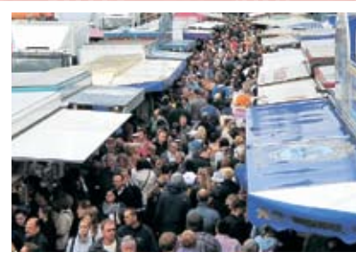
人でにぎわうフィッシュマルクト

この他に、チョコレート、パスタ類、うなぎの燻製、ソーセージ、チーズ、そしてなんと観葉