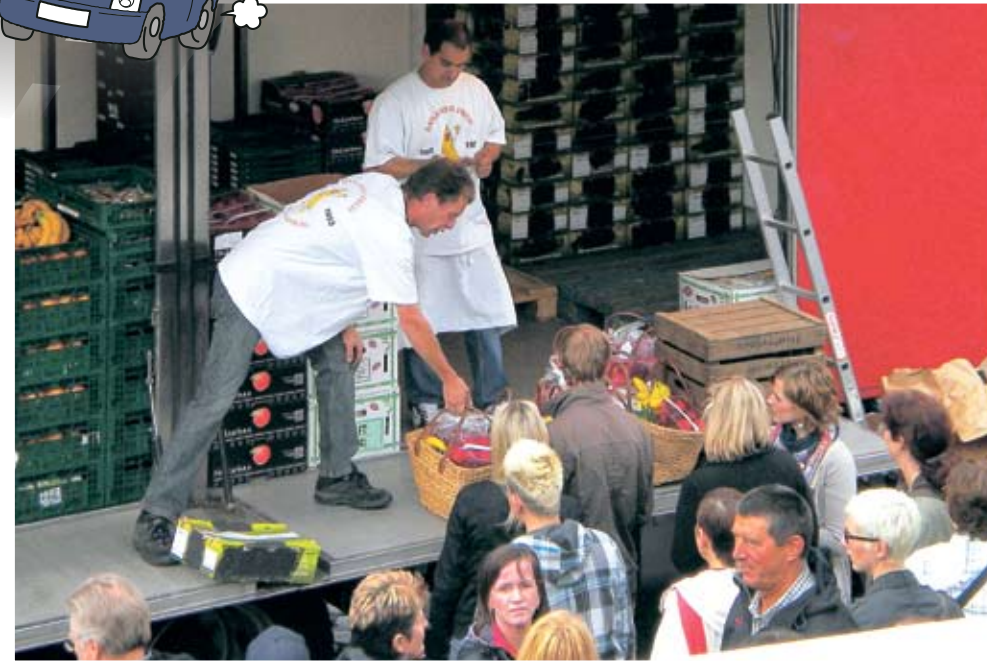
かごいっぱいに入れたたき売りのおじさんとそれに群がるお客さん